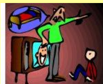
KRITIKA IN KAZEN

Ukrepi so odvisni od otrokovega obnašanja in rezultatov. Na starših pa je, da uravnotežijo količine posameznih delov trikotnika. Z modelom bo pokazano, kaj se zgodi v primeru, kadar tega starši ne storijo.