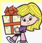
POHVALE IN NAGRADE